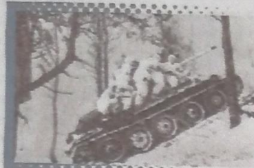
...:La guerra en Rusia