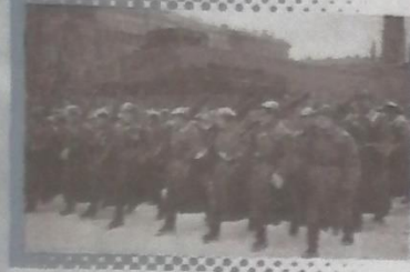
...:Soldados rusos en la Plaza Roja de Moscú