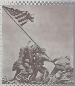
...Soldados estadounidenses plantan su bandera en Iwo Jima

La campaña de Italia. Después que Montgomery y Eisenhower lograran vencer a las fuerzas de Rommel en África, luego de una espectacular campaña conjunta (julio-agosto de 1943), tropas inglesas, canadienses y estadounidenses desembarcaron