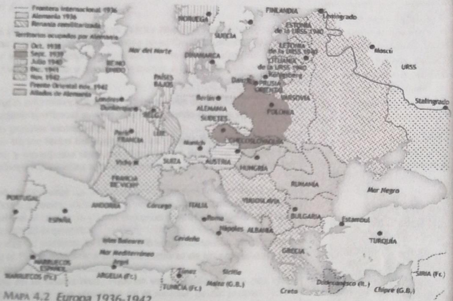
MAPA 4.2 Europa 1936-1942.

Durante el verano de 1941 Alemania se había apoderado de los Balcanes, mientras que Gran Bretaña dominaba el Cercano Oriente y, en el extremo oeste del Mediterráneo, la península y el estrecho de Gibraltar.