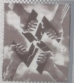
...Las Naciones Unidas contra el nazismo

La segunda fase de la guerra se caracteriza por la intervención de Estados Unidos y Japón, países que comenzaban a participar, sobre todo el primero, en las aspiraciones imperialistas del reparto mundial.