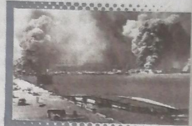
...:Ataque japonés a Pearl Harbor

Durante el verano de 1941 Alemania se había apoderado de los Balcanes, mientras que Gran Bretaña dominaba el Cercano Oriente y, en el extremo oeste del Mediterráneo, la península y el estrecho de Gibraltar.