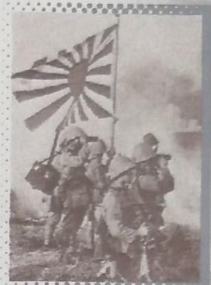
...Soldados japoneses plantan su bandera en Filipinas

b) Frente oriental. Hitler desencadenaba una nueva ofensiva contra la Unión Soviética buscando apoderarse de los territorios del Cáucaso, ricos en petróleo, a pesar de que las fuerzas alemanas ya se encontraban debilitadas. A mediados de noviembre de 1942, las tropas rusas —superiores en número a las alemanas y bien equipadas no sólo con recursos propios sino también con la ayuda proporcionada por Estados Unidos a través de la Ley de Préstamos y Arriendos— realizaron una contraofensiva que logró romper las líneas enemigas al norte y sur de Stalingrado y vencer a las fuerzas alemanas. Después de esta victoria, a pesar de algunos retrocesos, los rusos se mantuvieron a la ofensiva durante todo el resto de la guerra.